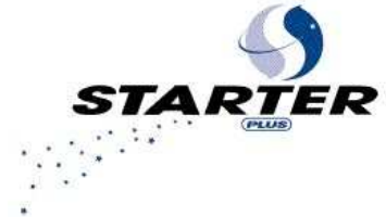
Starter Plus revendeurs