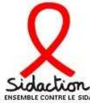
Sidaction Association pour l'aide aux malades et à la recherche